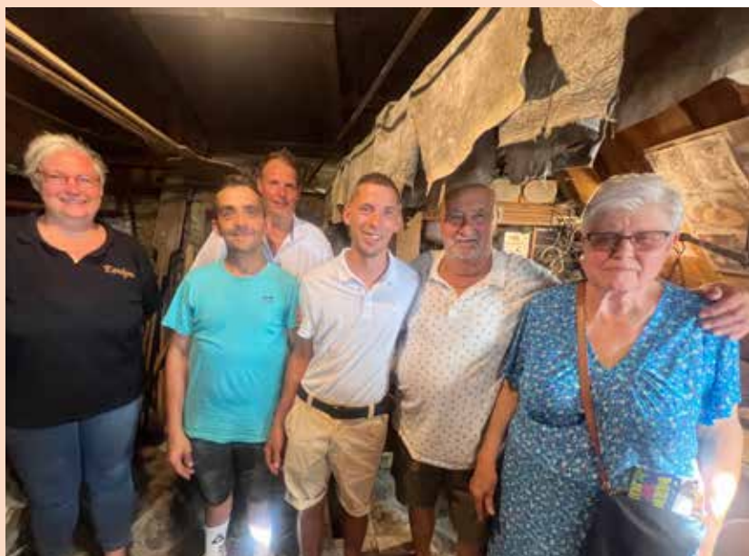
Inauguration du four