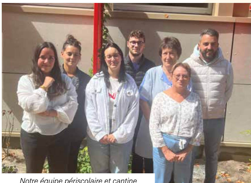
Notre équipe périscolaire et cantine