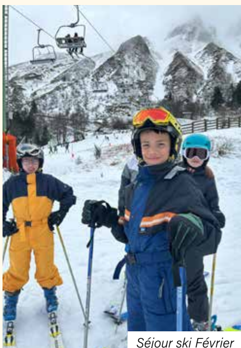
Séjour ski Février